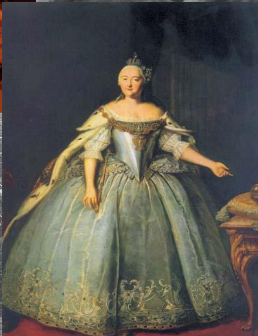
ЕЛИЗАВЕТЪ I Императрица и Самодержавица Всероссийская. ELISABETH I Russorum Imperatrix