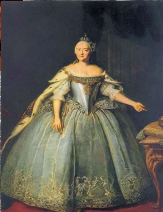
ЕЛИЗАВЕТЪ I Императрица и Самодержица Всероссийская. ELISABETH I Russoorum Imperatrix