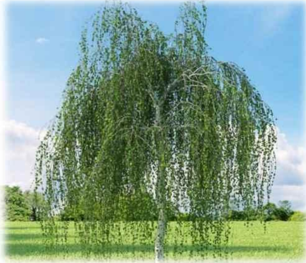
Береза повислая Клен остролистный