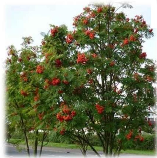
Рябина обыкновенная Туя западная