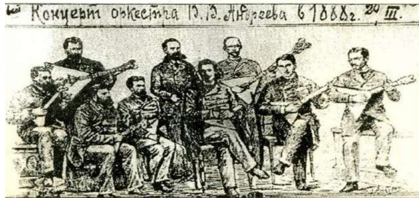
Кружок балалаечников под управлением В.В. Андреева. 1888 г.