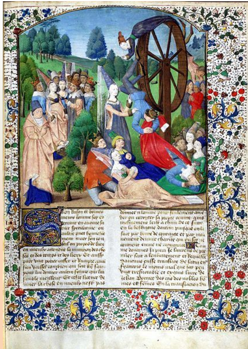
Иллюстрация к книге Боккаччо «О несчастиях знаменитых людей»: Фортуна крутит колесо удачи. Париж, 1467