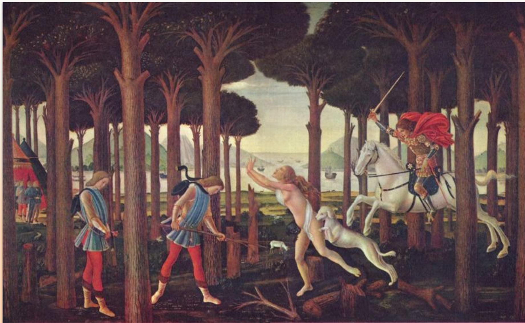
Сандро Боттичелли. Иллюстрация к новелле о Настаджо дельи Онести, 1487 Мадрид, музей Прадо