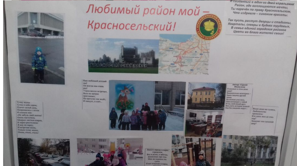
Стенгазета для родителей к знаменательным праздникам