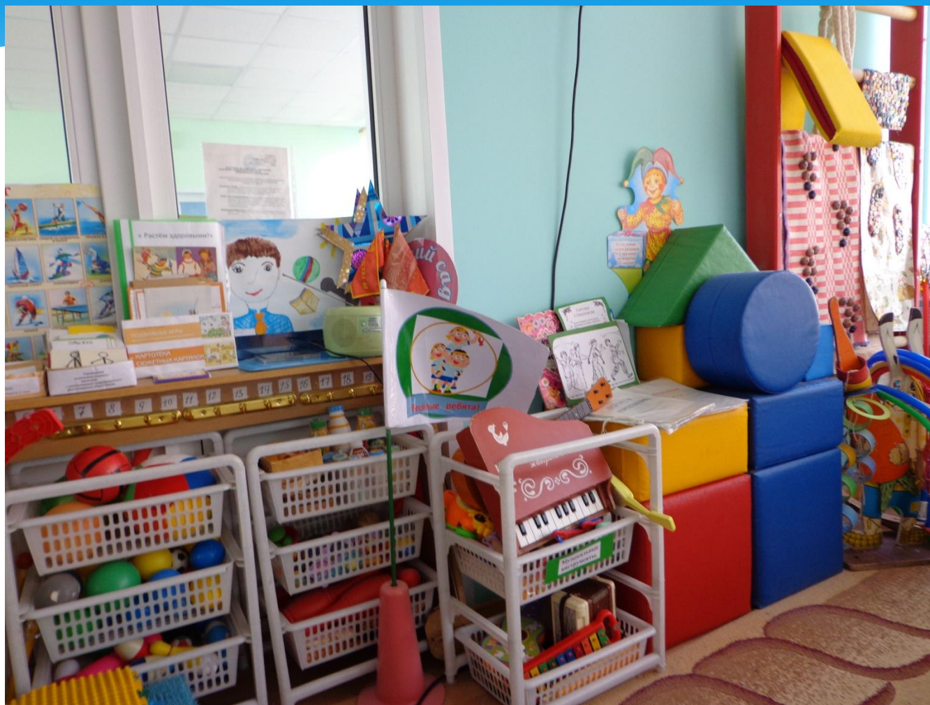
Центр развития двигательной активности.