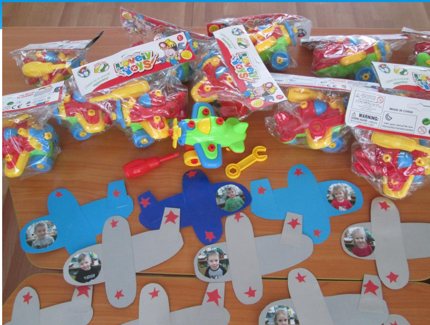
Подарки папам и мальчикам.