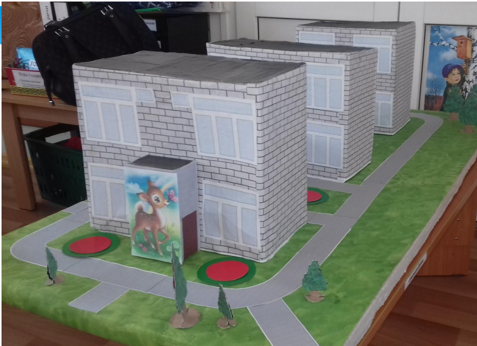
Макет нашего детского сада. Работа Паниной Элеоноры.