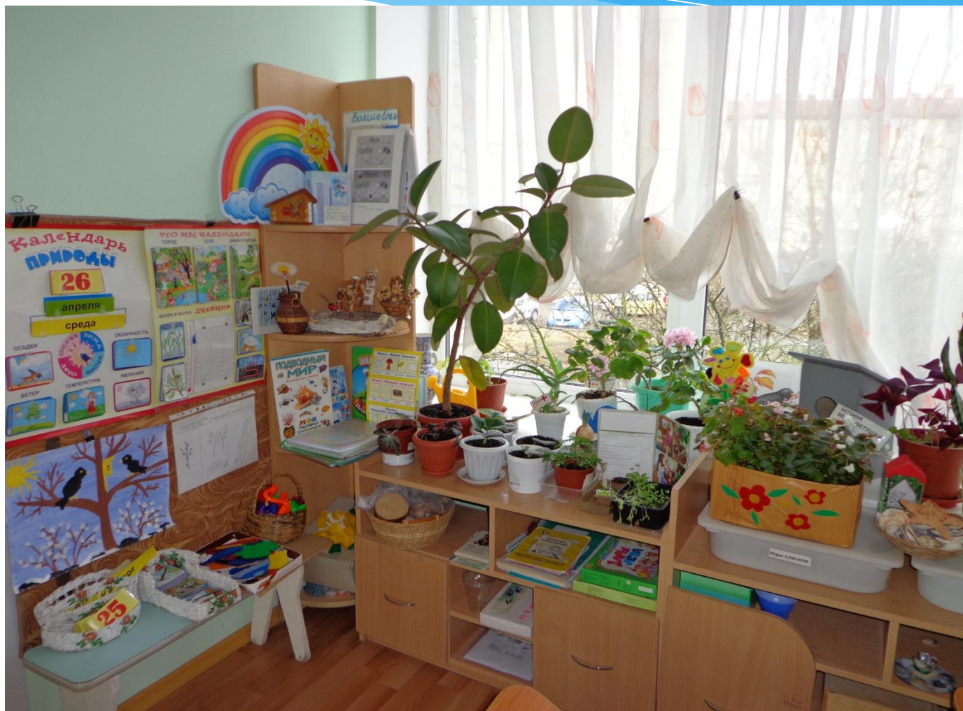
Уголок природы и экспериментирования.