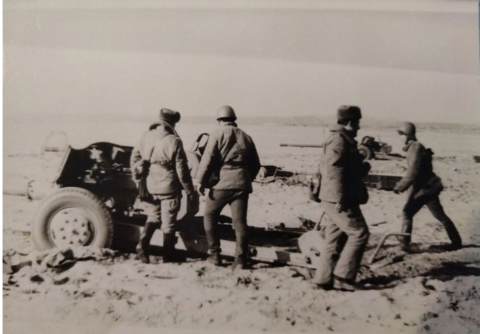
Саонов С. Е. на учениях на Украине.