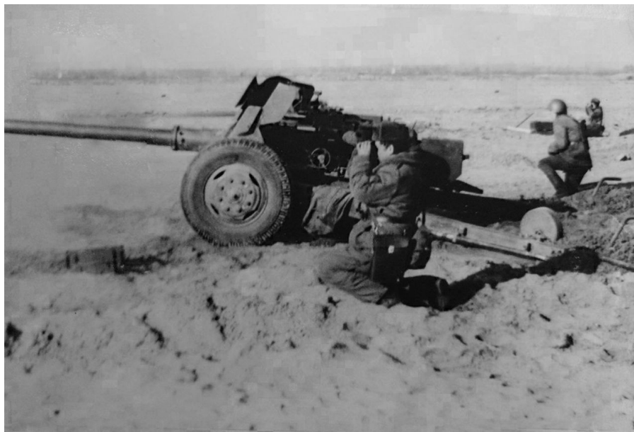
Саонов С. Е. на боевых учениях на полигоне в Узбекистане