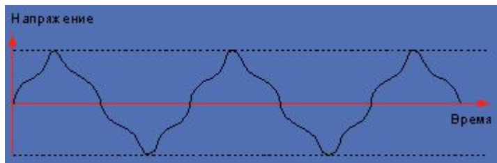
Рисунок 2. Несинусоидальное напряжение.