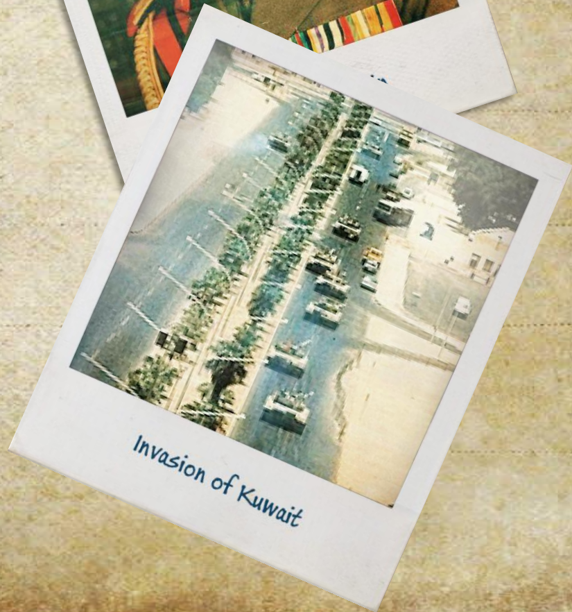
Invasion of Kuwait

• После окончания войны с Ираном в 1988 году, президент Ирака Саддам Хусейн столкнулся с серьёзными экономическими проблемами — он должен был срочно выплатить Саудовской Аравии и Кувейту долги, накопленные за время войны. С этой проблемой Саддам решил справиться радикальным путём: Хусейн обвинил Кувейт в том, что тот производит больше нефти, чем указано в договоренностях, а также в том, что ворует топливо из иракских скважин. Багдад потребовал от Кувейта компенсации «потерь» в 2 400 000 000 долларов за якобы незаконную добычу нефти в приграничном месторождении, списания задолженности по займам, полученным во время ирано-иракской войны (17 000 000 000 долларов), уступки или сдачи в аренду Ираку стратегически важных островов Варба и Бубиян. Кувейт ответил отказом.