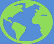
Схема направления граждан РК на лечение за рубеж за счет бюджетных средств