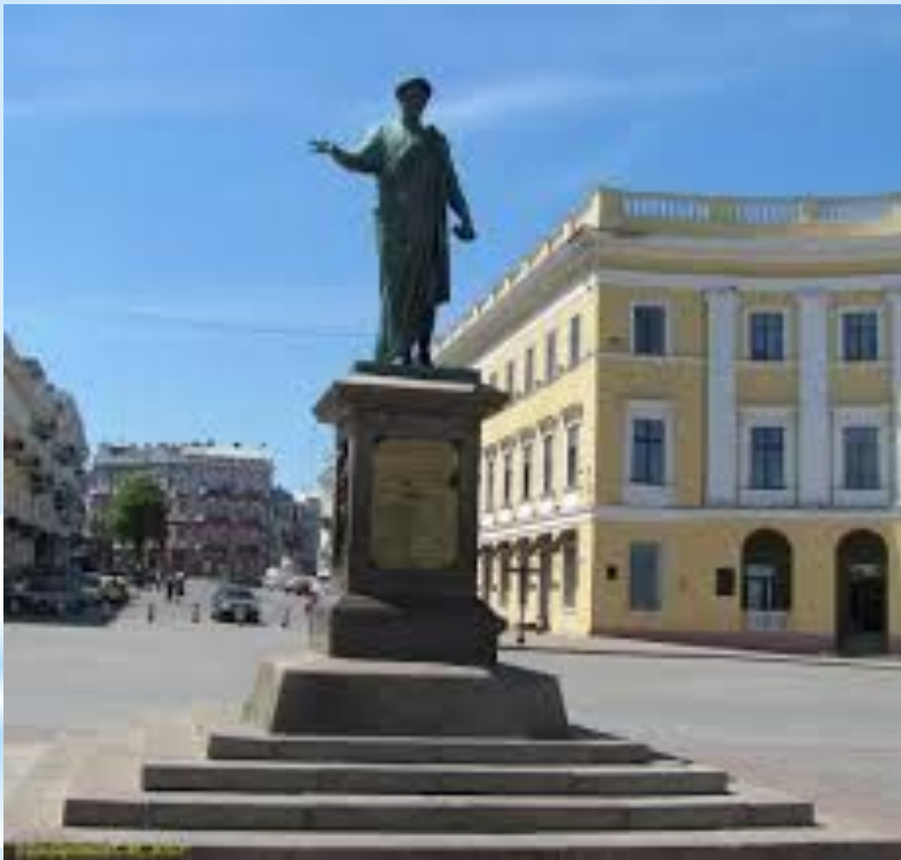
Одесса. Памятник Дюку де Ришелье