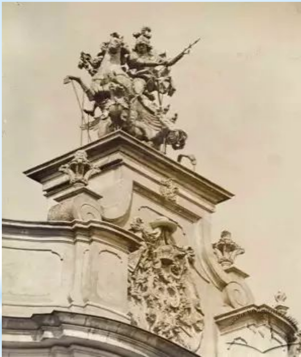
Скульптурна група Св. Юрій-Зміборець роботи Й.-Г. Пінзеля на аттику Собора Св. Юра