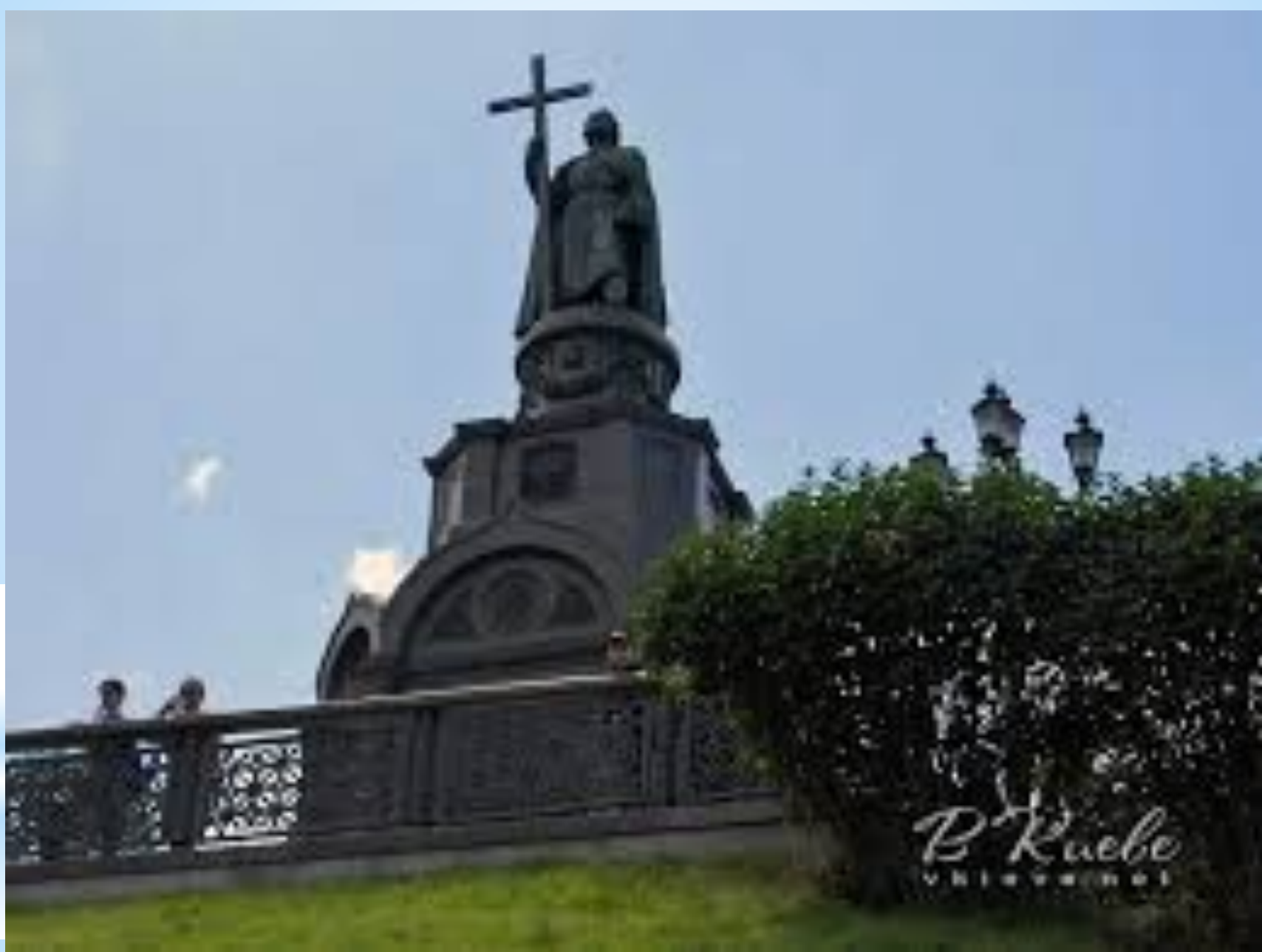
Пам'ятник князю Володимиру