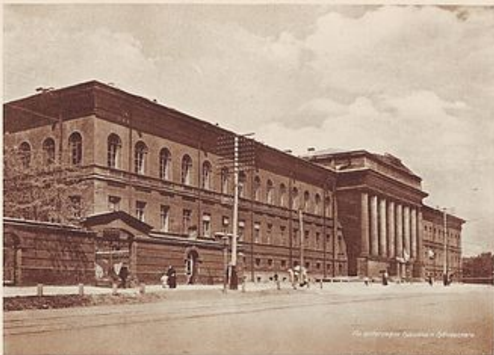
Императорской Университетъ св.Владимира.