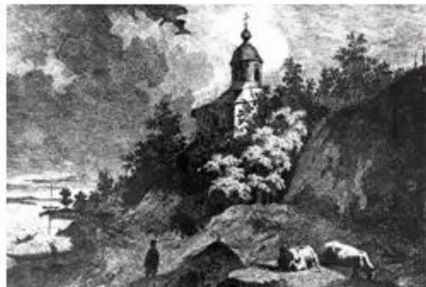
Т.Шевченко. Видубицький монастир у Києві