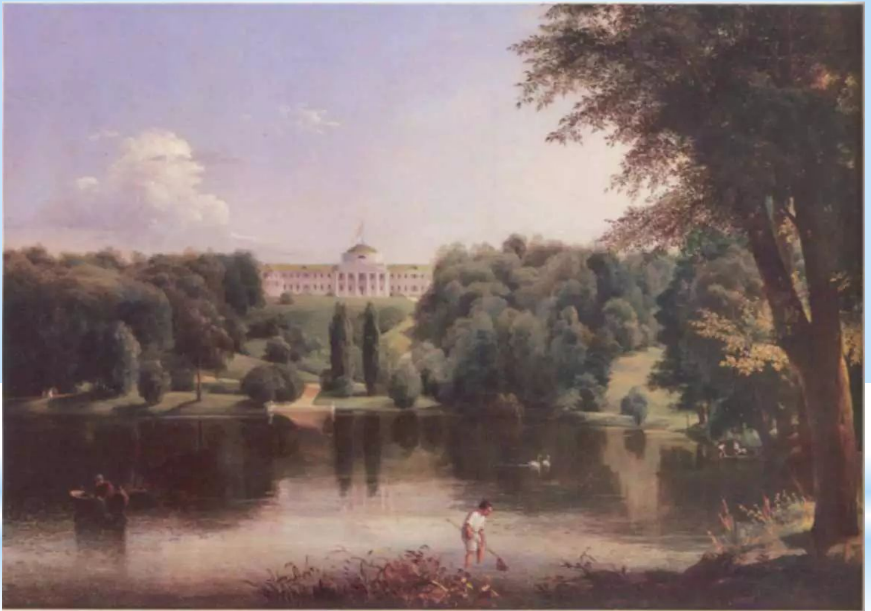
Садиба Г.С.Тарновського в Качанівці. Штернберг В І. 1837 р.