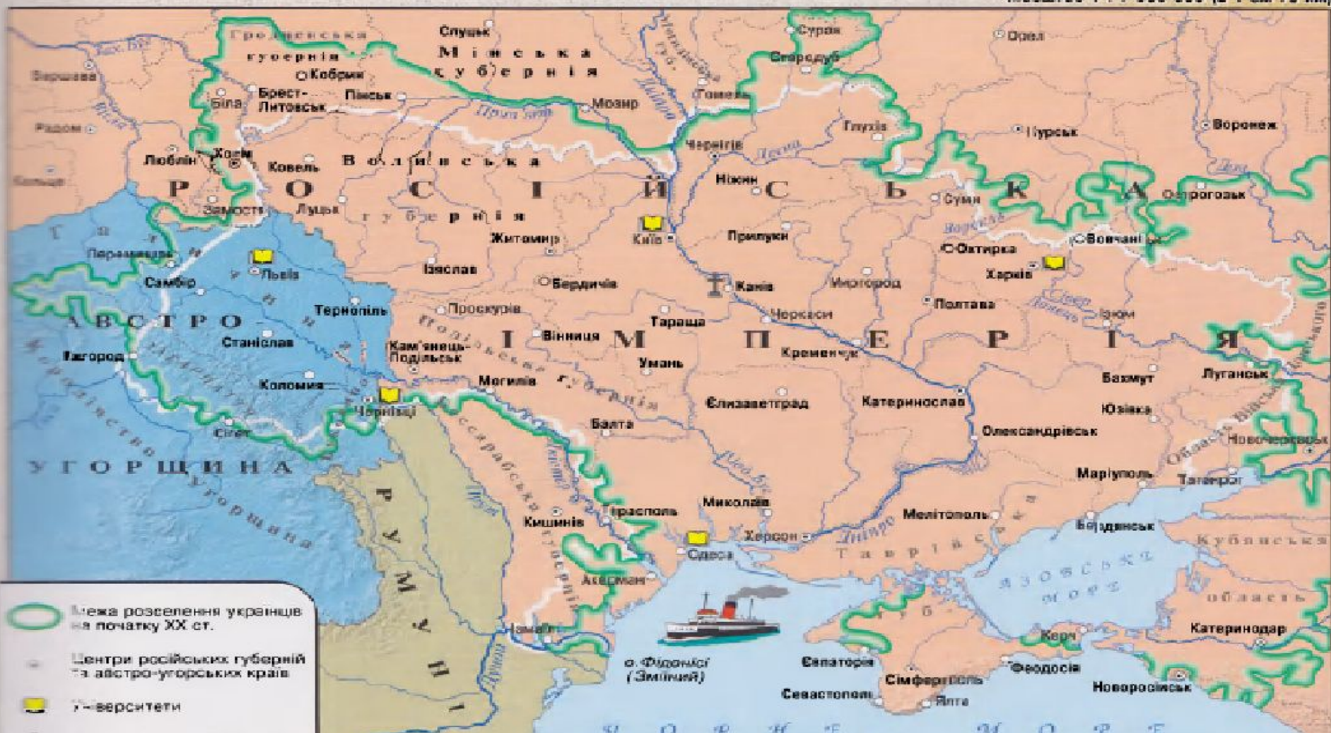
Масштаб 1 : 7 900 000 (в 1 см 79 км)

19 століття увійшло в історію України як період її національного відродження. Розділений кордонами український народ не втратив прагнення до волі. З-поміж освічених українців поживавлюється інтерес до народної творчості, історії та культури. З'являються видання українських народних пісень, дум, переказів. Після виходу у світ "Енеїди" Івана Котляревського розвивається нова українська література. Історики розшукують та публікують документи українського минулого. Своїм віднесенням український рух завдячував сузір'ю талановитих особистостей – Миколі Костомарову, Іванові Франку, Лесі Українці. Символом українського відродження став Тарас Шевченко.