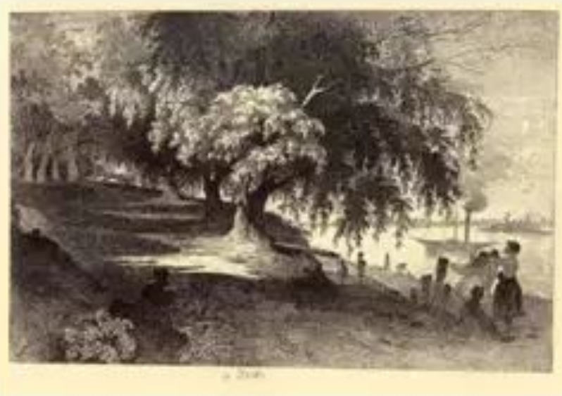
Т.Шевченко. У Києві