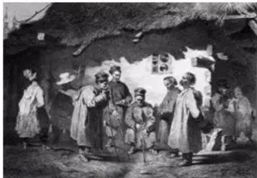
Т.Шевченко. Судня рада