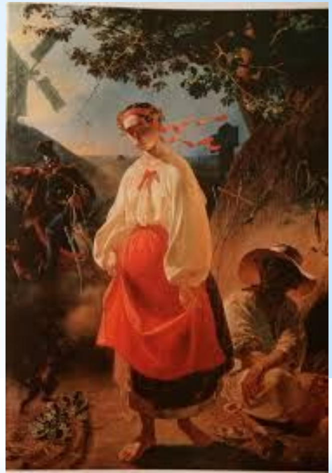
«Катерина» 1842 р