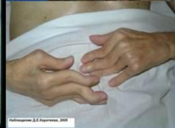
Издание Д.Е. Карцева, 2009