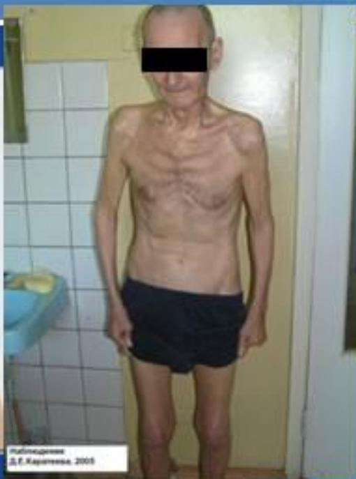
Издание Д.Е. Карцева, 2009