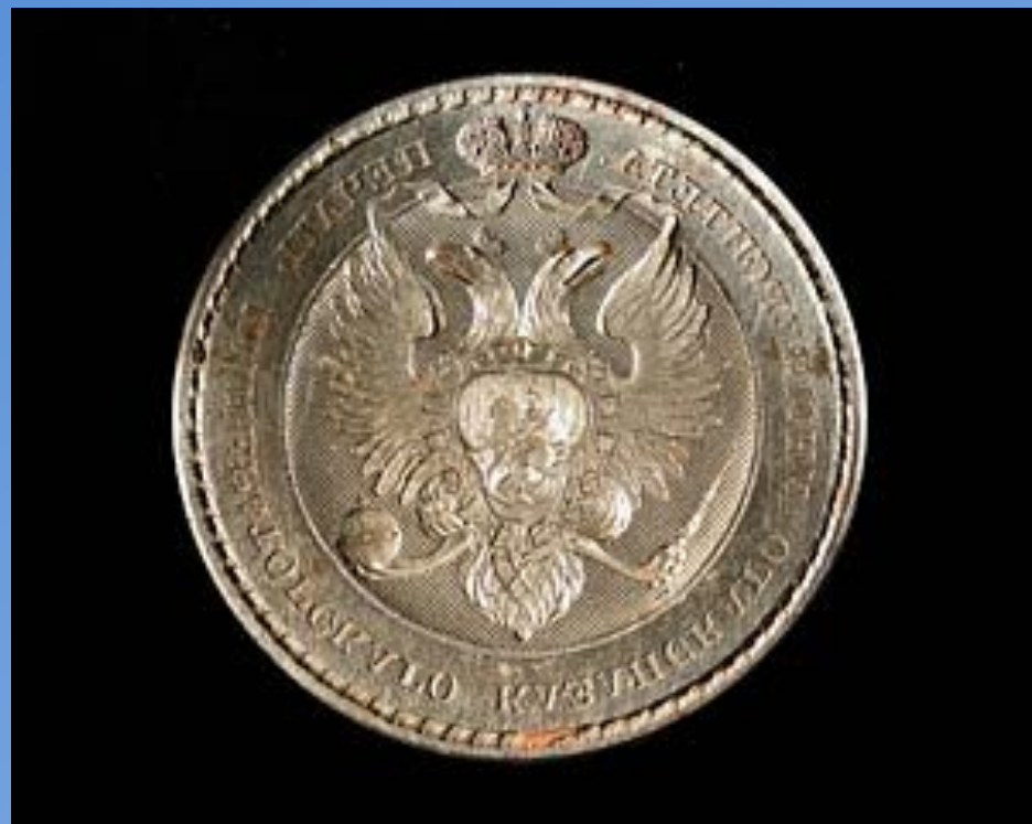
Печать Императорского Казанского университета. Россия. XIX. Сталь