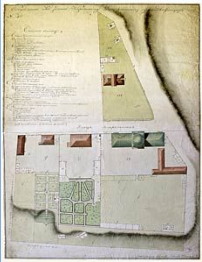
Петровский С. Общий план всех зданий Императорского Казанского университета. Казань. 1830-е. Бумага, акварель, тушь, перо