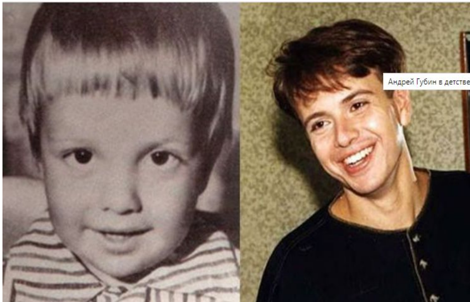
Андрей Губин в детстве