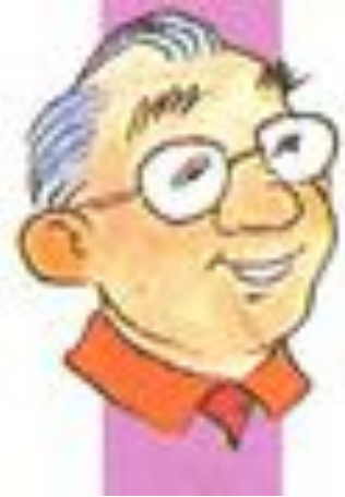
a grand father