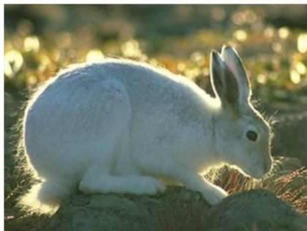
Заяц - беляк