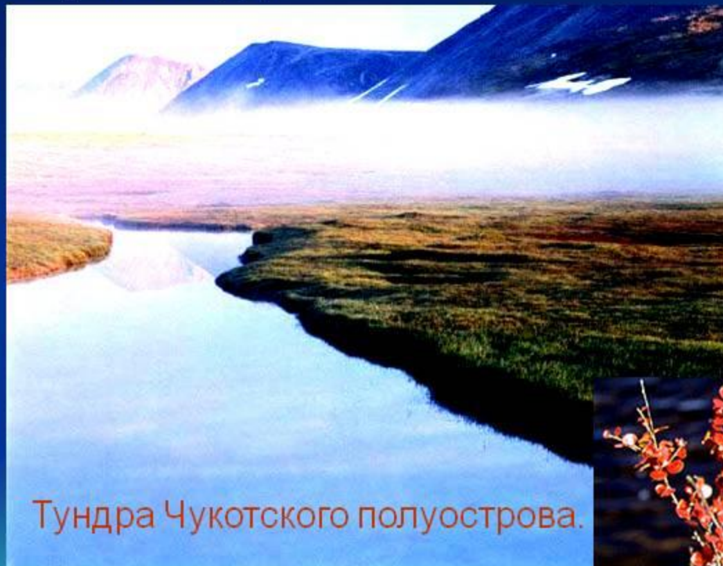
Тундра Чукотского полуострова.

Тундра характеризуется безлесием. Среди скудной растительности встречаются ягодные кустарнички, карликовые деревья.