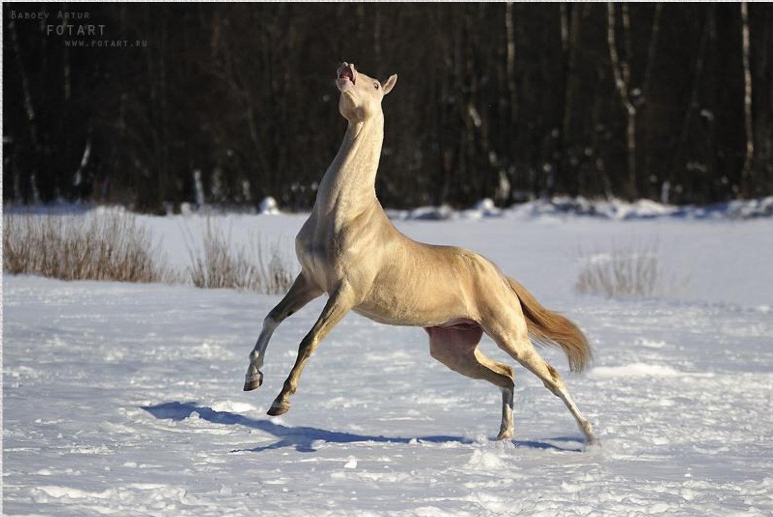
Лошадь Ахалтекинской породы, изабелловой масти

Известно более 100 пород лошадей. Лошади используются в различных целях.