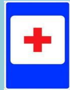
пункт медицинской помощи