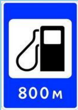
авто заправочная станция

А ещё есть знаки- добрые друзья: Укажут направление вашего движения, Где поесть, заправиться, поспать, И как в деревню к бабушке попасть.