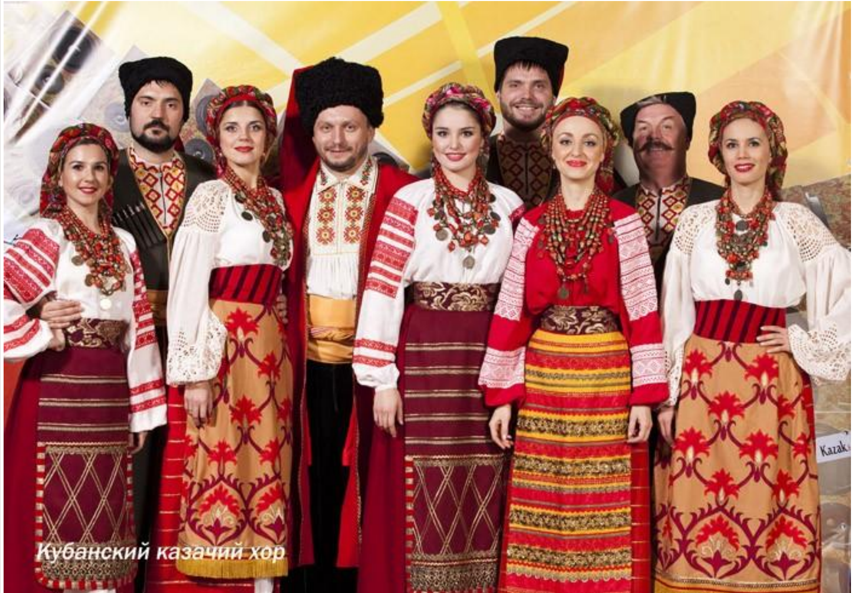
Кубанский казачий хор