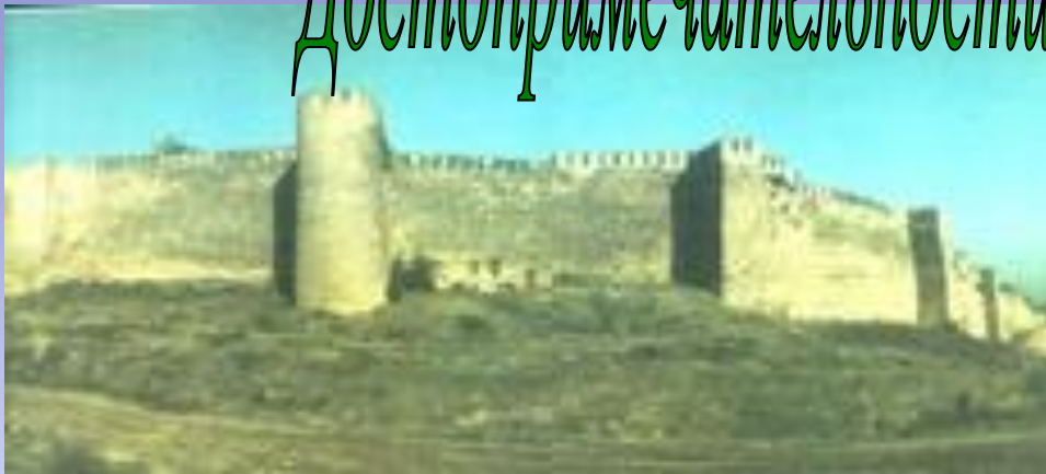
Цитадель Нарын-Кала. Вид с юга.