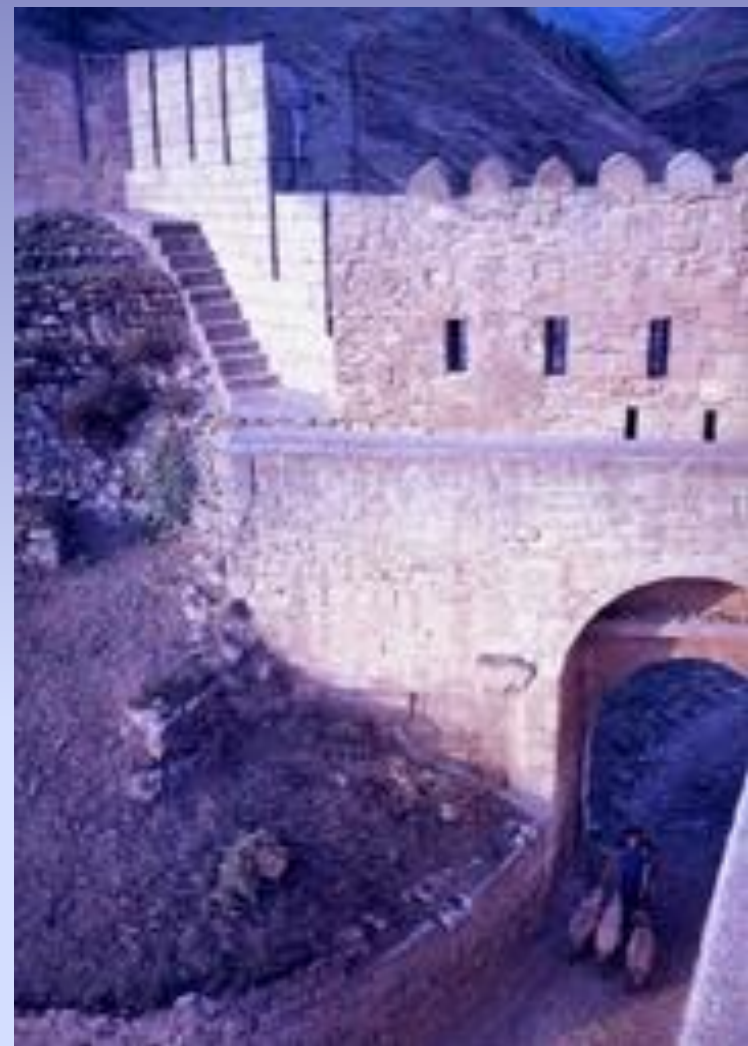
Ворота Джарчи-капы. Вид с внутренней стороны.