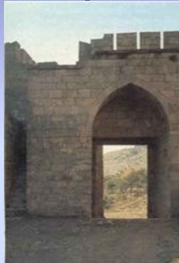
Ворота Кала-Капы. Вид с внутренней стороны.