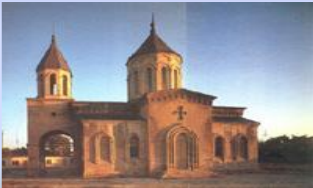
Армянский храм. XIX в.