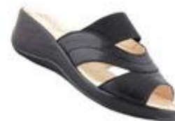
Сабо женские, Health Shoes

Цена: 1390.00 руб. Бренд: HEALTH SHOES Продавец: БАШМАЧНИКОФФ