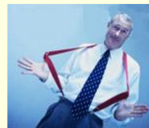
Подтяжки для брюк, помочи детские