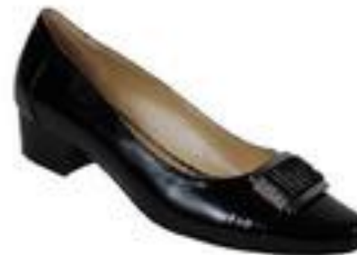
Туфли женские, Marta

Цена: 3590.00 руб. Бренд: MARTA Продавец: БАШМАЧНИКОФФ