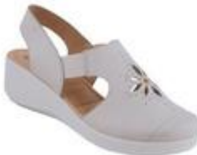
Босоножки женские, Health Shoes

Цена: 1390.00 руб. Бренд: HEALTH SHOES Продавец: БАШМАЧНИКОФФ