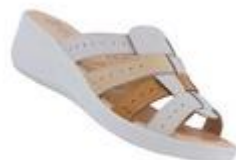
Сабо женские, Health Shoes

Цена: 1390.00 руб. Бренд: HEALTH SHOES Продавец: БАШМАЧНИКОФФ