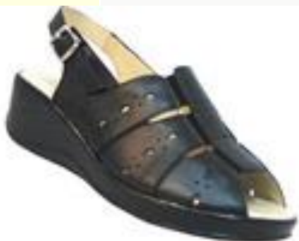
Босоножки женские, Health Shoes

Цена: 1390.00 руб. Бренд: HEALTH SHOES Продавец: БАШМАЧНИКОФФ