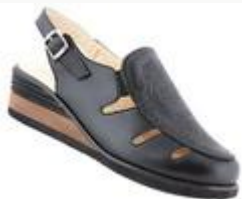
Босоножки женские, Health Shoes

Цена: 1390.00 руб. Бренд: HEALTH SHOES Продавец: БАШМАЧНИКОФФ