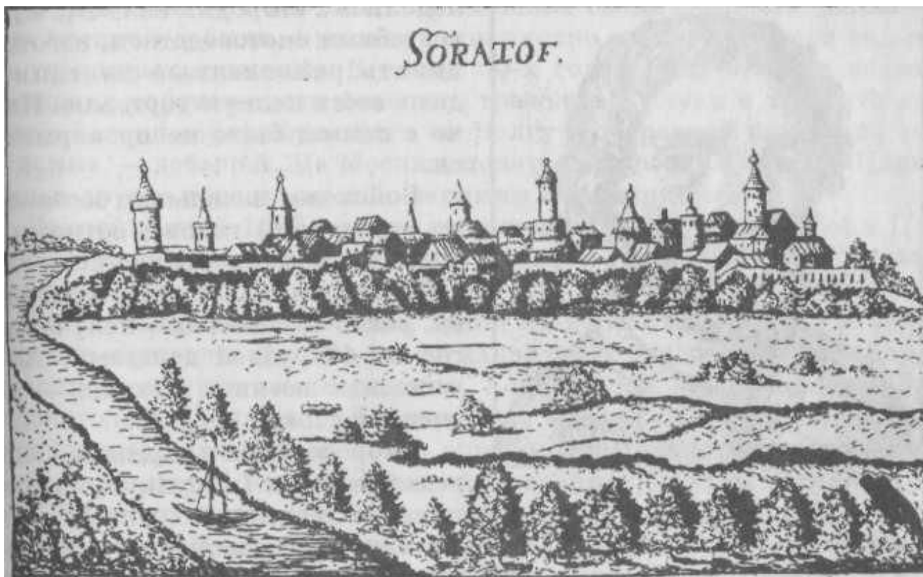
Саратов левобережный. С рисунка худ. А. Олеария. 1636 г.

И скромным именем Саратов его не веки нарекли.