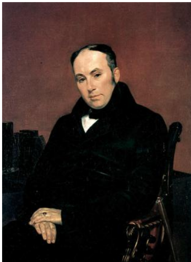
Жуковский Василий Андреевич