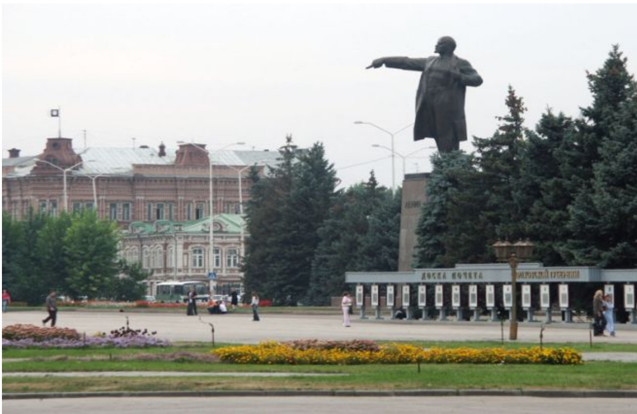
Театральная площадь г. Саратов

огромных площадей не счесть они, конечно же, по праву ему даруют только честь.