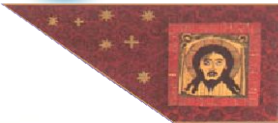
Знамя Ивана Грозного