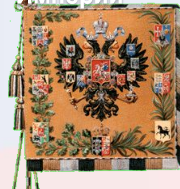
Государственное знамя Российской Империи