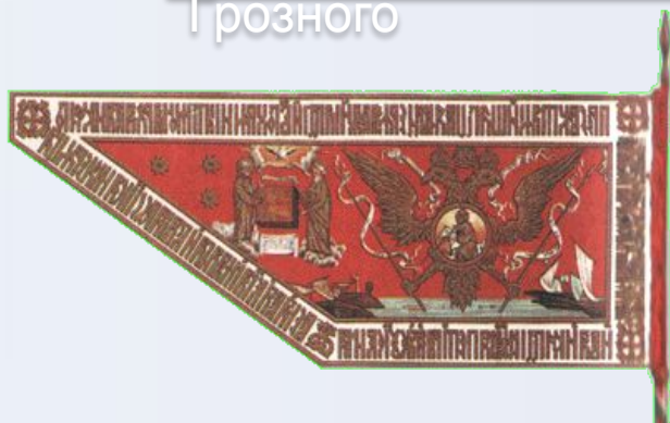
Знамена царя Алексея Михайловича, «гербовые знамёна»