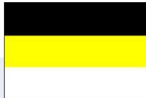
Государственный флаг Российской Империи