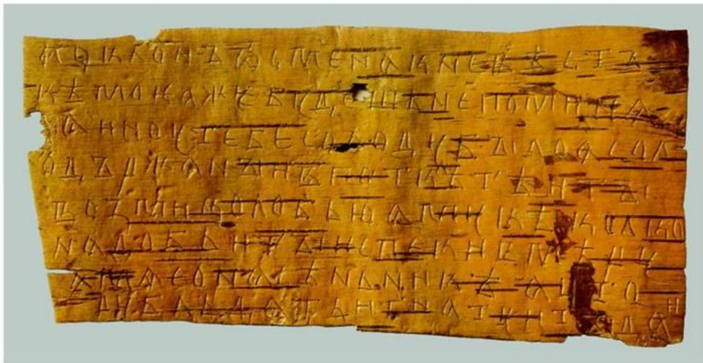
Грамота № 363. Конец XIV в. Письмо Семёна невестке с хозяйственными распоряжениями. Размер 16,4 × 8 см.