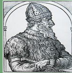
Иван III (1462-1505)