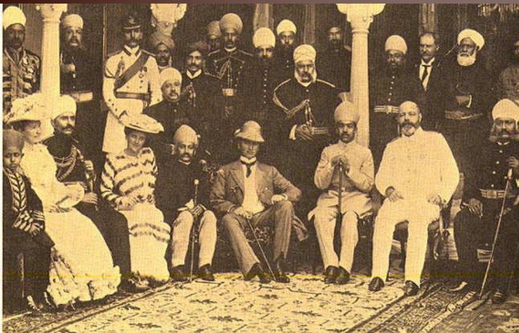
Вице-король Индии лорд Керзон в окружении индийской знати