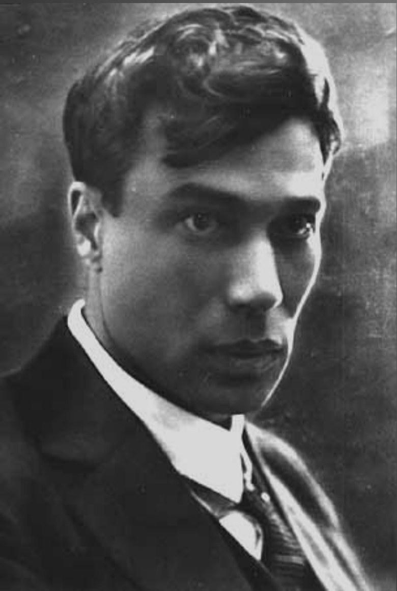
Пастернак, Борис Леонидович (1890-1960)