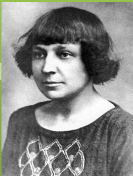
Марина Цветаева в 1924-м году