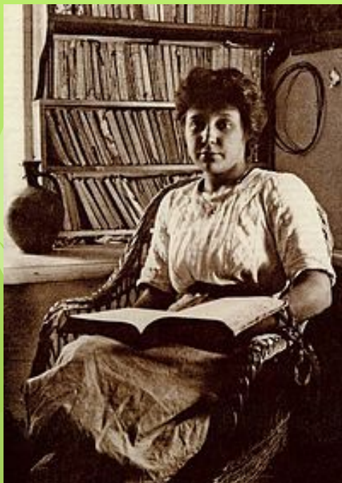
Марина Цветаева. 1911 год. Фото Максимилиана Волошина