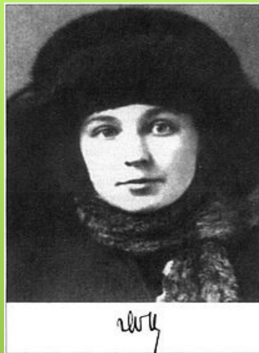
Марина Цветаева с автографом. Фото ок. 1917 года