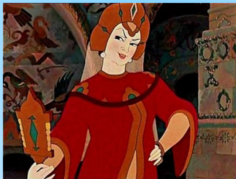
Сказка о мертвой царевне и семи богатырях