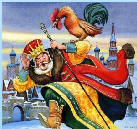
Сказка о золотом петушке