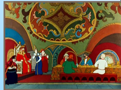
Сказка о царе Салтане