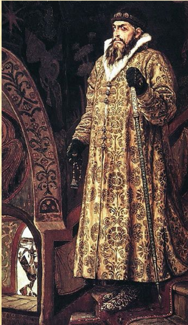
Иван IV Грозный

В 1837 году выходит «Песня про царя Ивана Васильевича молодого опричника и удалого купца Калашникова»