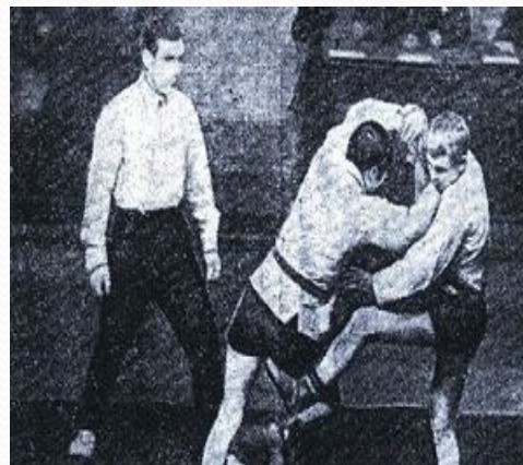
Турнир по самбо в Риге 1967г.

В 1966 году на конгрессе Международной федерации любительской борьбы (ФИЛА) самбо официально признается международным видом спорта . Начался уверенный рост популярности самбо по всему миру. Уже на следующий год в Риге состоялся первый международный турнир по самбо, в котором приняли участие спортсмены Югославии, Японии, Монголии, Болгарии и СССР. В 1972 году проходит первый открытый чемпионат Европы, а в 1973 году — первый чемпионат мира, в котором приняли участие спортсмены из 11 стран. В последующие годы регулярно проводятся чемпионаты Европы, мира, международные турниры. Создаются федерации самбо в Испании, Греции, Израиле, США, Канаде, Франции и других странах. В 1977 году самбисты впервые выступают на Панамериканских играх; в этом же году впервые разыгрывается Кубок мира по самбо. В 1979 году проводится первый чемпионат мира среди молодёжи, а через два года — первый чемпионат мира среди женщин. Также в 1981 году самбо вошло в Боливарианские игры Южной Америки.