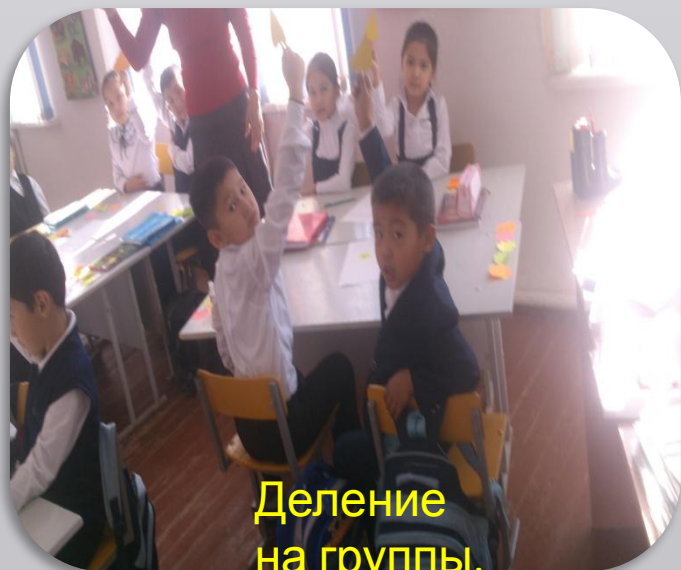
Деление на группы.