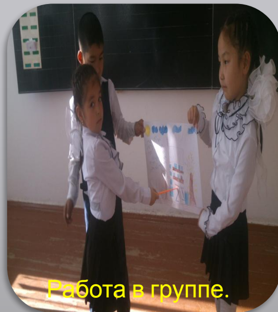
Работа в группе.

Осенью деревья дарят елочке подарки. Осина дарит красные китайские фонарики. Клен роняет оранжевые звезды. Ива засыпает елочку золотыми рыбками. И стоит елочка нарядная. Раскинула ветки, а на ладожках подарки.