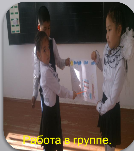
Работа в группе.

Осенью деревья дарят елочке подарки. Осина дарит красные китайские фонарики. Клен роняет оранжевые звезды. Ива засыпает елочку золотыми рыбками. И стоит елочка нарядная. Раскинула ветки, а на ладожках подарки.