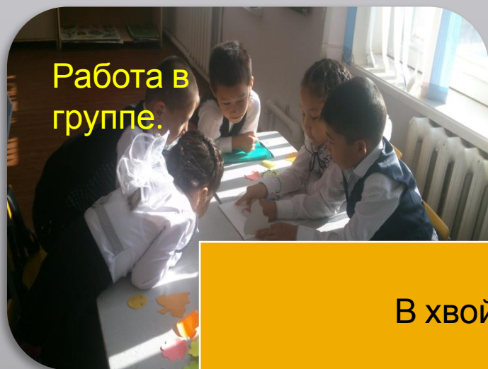
Работа в группе.

В хвойном лесу выросла красавица-елка. Ель была очень высокая, стройная, как свеча. Ее темно-коричневый ствол был покрыт толстой, шершавой корой. Далеко в стороны раскинула она свои тяжелые, мохнатые ветки. Каждая ветка покрыта тонкими, колючими иголками.