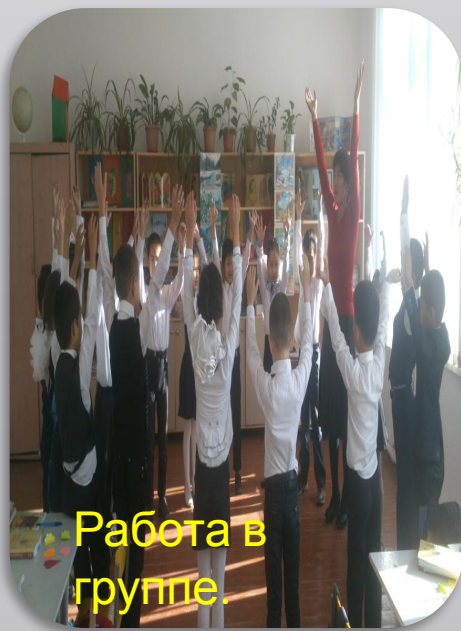
Работа в группе.