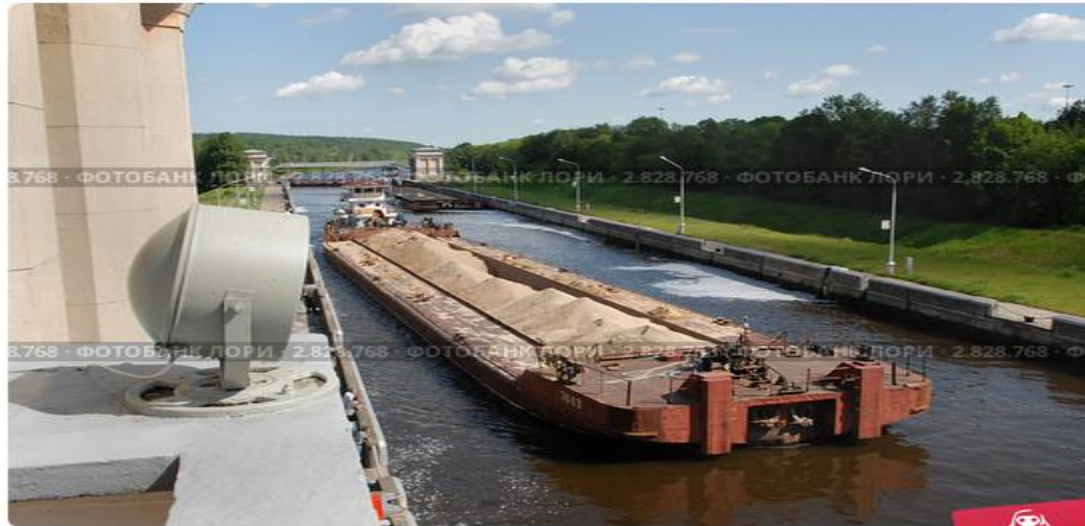
Баржа с песком в шлюзе гидроузла

Баржа с грузом металлолома вошла в шлюз. По какой-то неизвестной причине матросы на барже начали сбрасывать металлолом в воду и занимались этим до тех пор, пока полностью не опустошили трюмы баржи. Что произойдёт с уровнем воды в шлюзе?