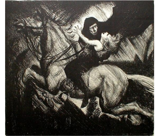
The Erlking by Albert Sterner, ca 1910