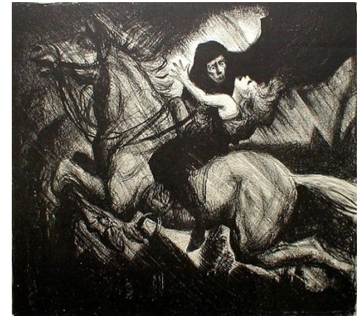
The Erlking by Albert Sterner, ca 1910