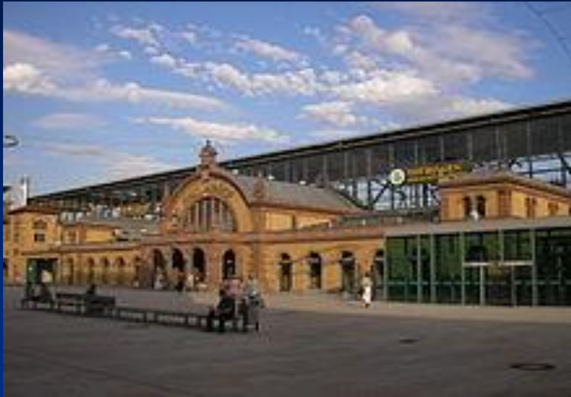
Der Erfurter Hauptbahnhof