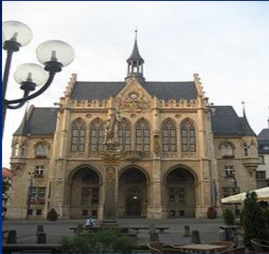
Erfurter Rathaus 2008, Sitz des Oberbürgermeisters