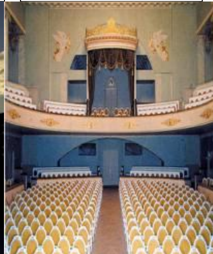
die Oper (-s)