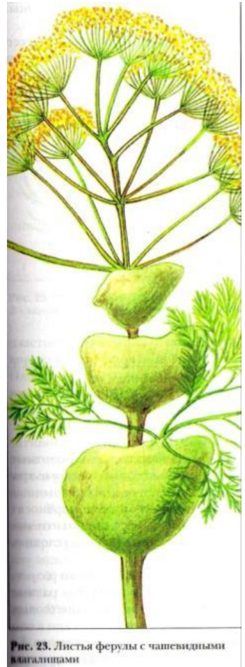
Рис. 23. Листья ферулы с чашевидными влагалищами