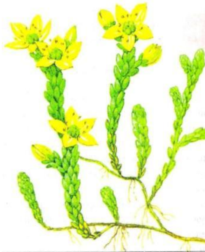
Рис. 24. Очиток едкий – листовой суккулент

В Средней полосе России на сухих, сильно прогреваемых склонах растет небольшое растение очиток едкий (рис. 24), а в сосняках на сухой песчаной почве — молодило побегоносное . Эти листовые суккуленты, чтобы высушить для гербария, предварительно ошпаривают кипятком, иначе живые листья будут прочно удерживать воду и не засохнут. У этих растений при сушке могут раскрыться и зацвести бутоны.