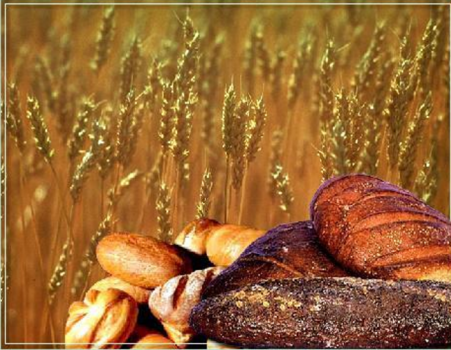
Пшеница и выпечка из пшеничной муки.