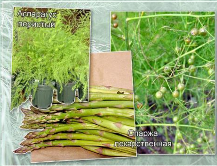
Побеги и плоды различных видов аспарагуса.

Различные виды спаржи (или аспарагуса) также относятся к лилейным. Среди них есть как корневищные растения, так и растения, образующие клубни.