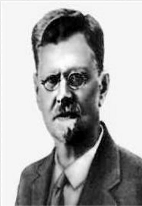
ЧЕТВЕРИКОВ Сергей Сергеевич (1880-1959)