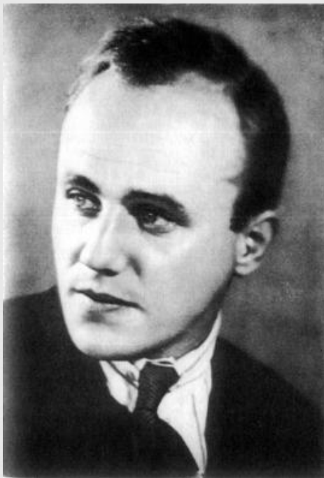
ДУБИНИН Николай Петрович (1906—1998)