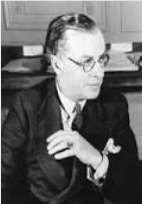
ХАКСЛИ Джулиан Сорелл (1887-1975)