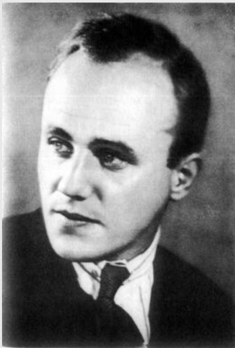
ДУБИНИН Николай Петрович (1906—1998)