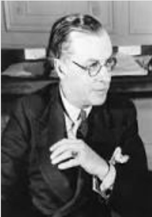
ХАКСЛИ Джулиан Сорелл (1887-1975)