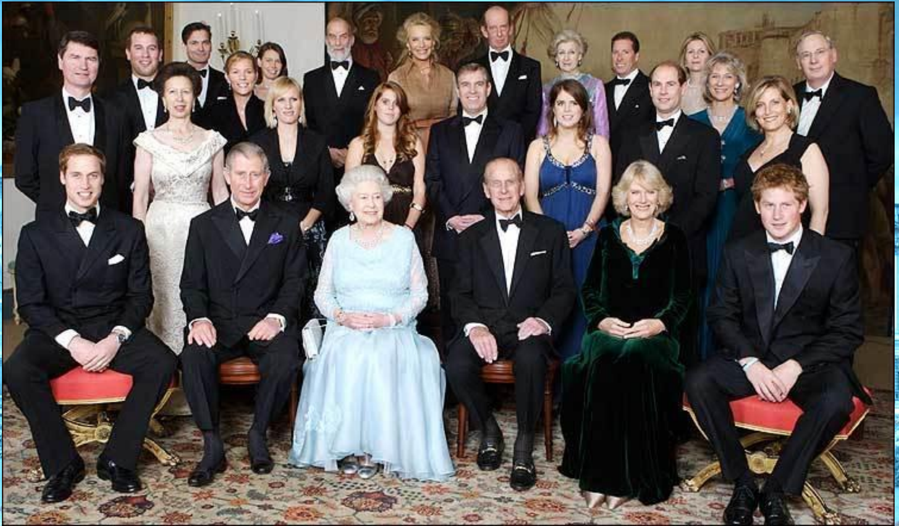
Члены королевской семьи (наши дни)