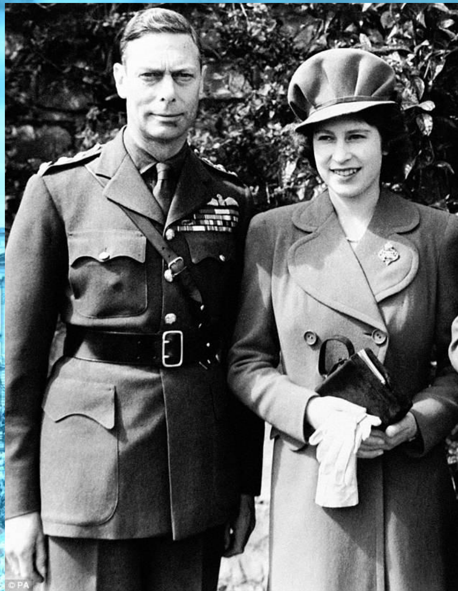
Принцесса Елизавета с отцом.

Король Георг VI умер 6 февраля 1952 года. Елизавета, находившаяся на отдыхе в Кении, была провозглашена королевой.