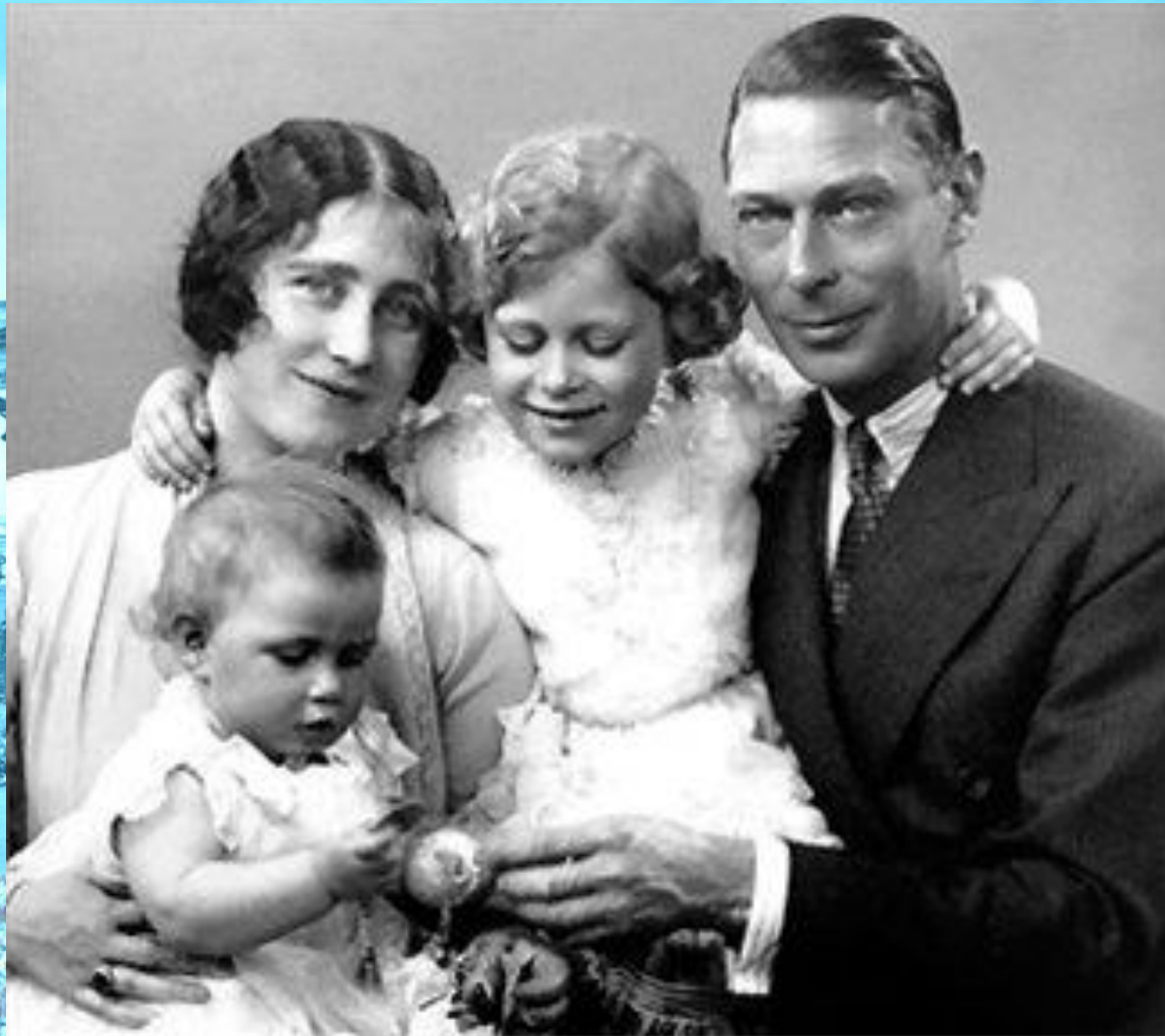
Принц Альберт, леди Елизавета Боуз-Лайон и их дочери Елизавета и Маргарет

Личность Елизаветы II сформировывалась на фоне всеобщей заботы и любви. С раннего детства ее воспитанию и образованию уделялось огромное внимание.