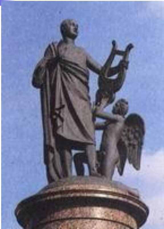
Памятник Ломоносову в г. Архангельске