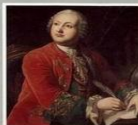
М.В.Ломоносов. Неизвестный художник XVIII в. Архангельская областная краеведческая музей

Ломоносов считал химию своей «главной профессией», причем развитие химии, по мнению ученого, должно было помочь решению практических задач. «Истинный химик должен быть теоретиком и практиком», — писал он. Став профессором химии, Ломоносов начал добиваться создания химической лаборатории.