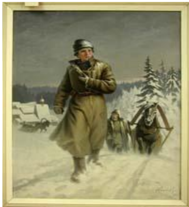
Н.И. Кисляков «Юноша Ломоносов на пути в Москву»