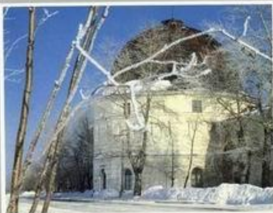
Гостиный двор Архангельска. Современный вид