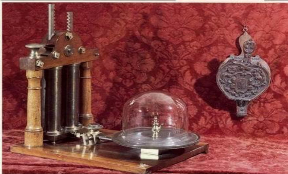
Вспомогательный аппарат XVIII в. Музей М.В.Ломоносова, Ленинград

Ломоносов считал химию своей «главной профессией», причем развитие химии, по мнению ученого, должно было помочь решению практических задач. «Истинный химик должен быть теоретиком и практиком», — писал он. Став профессором химии, Ломоносов начал добиваться создания химической лаборатории.