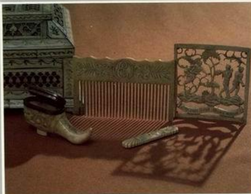
Резьба кости. Тугой и грабли для коня. Музей М.В.Ломоносова. Ленинград