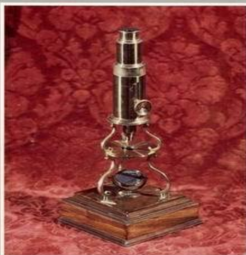
Микроскоп XVIII в. Музей М.В.Ломоносова. Литомграфия