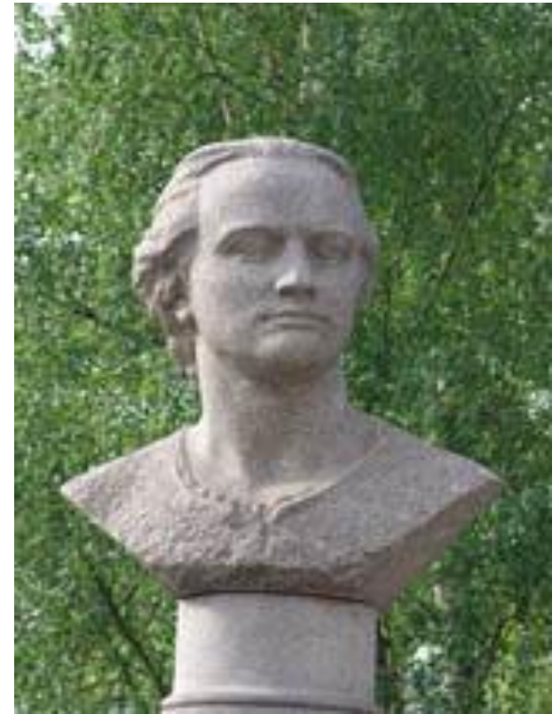
Памятник Ломоносову в г. Архангельске у ПГУ им М.В.Ломоносова