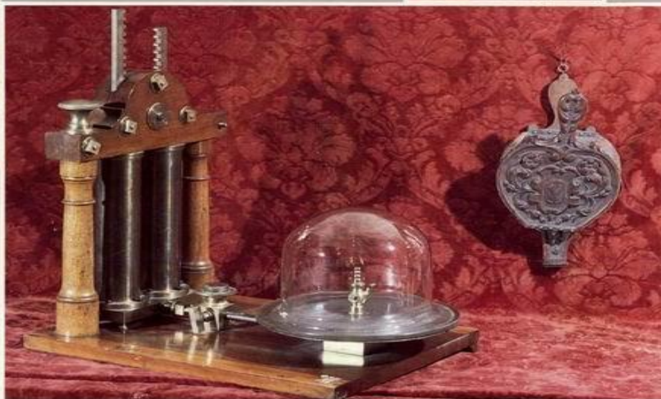
Вспомогательный аппарат XVIII в. Музей М.В.Ломоносова. Литомграфия

Ломоносов считал химию своей «главной профессией», причем развитие химии, по мнению ученого, должно было помочь решению практических задач. «Истинный химик должен быть теоретиком и практиком», — писал он. Став профессором химии, Ломоносов начал добиваться создания химической лаборатории.