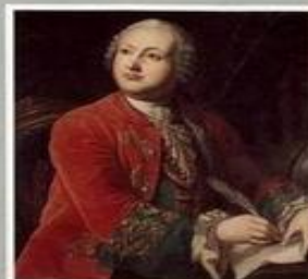
М.В.Ломоносов. Неизвестный художник XVIII в. Архангельский областной краеведческий музей

Ломоносов считал химию своей «главной профессией», причем развитие химии, по мнению ученого, должно было помочь решению практических задач. «Истинный химик должен быть теоретиком и практиком», — писал он. Став профессором химии, Ломоносов начал добиваться создания химической лаборатории.