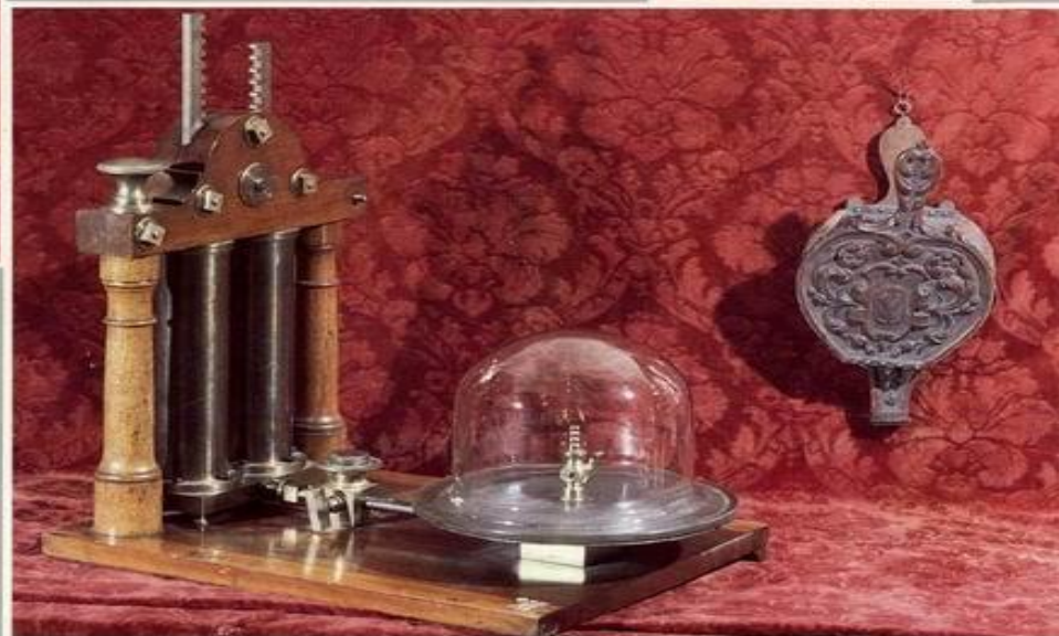
Вспомогательный аппарат XVIII в. Музей М.В.Ломоносова, Ленинград

Ломоносов считал химию своей «главной профессией», причем развитие химии, по мнению ученого, должно было помочь решению практических задач. «Истинный химик должен быть теоретиком и практиком», — писал он. Став профессором химии, Ломоносов начал добиваться создания химической лаборатории.