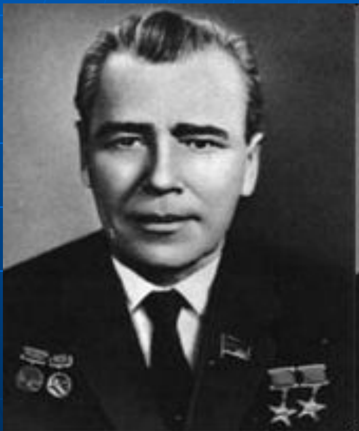
М. К. Янгель