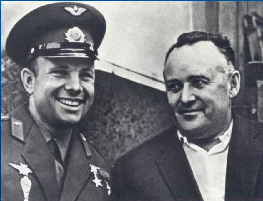
Ю. А. Гагарин и С. П. Королев