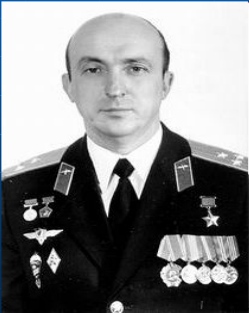
Васютин Владимир Владимирович, Лётчик-космонавт СССР, генерал- лейтенант, Герой Советского Союза.