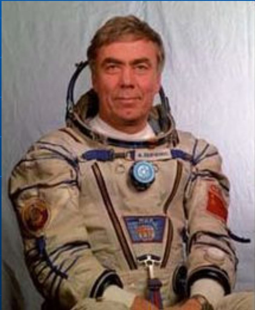
Левченко Анатолий Семенович (Харьковская обл.), советский космонавт, Герой Советского Союза