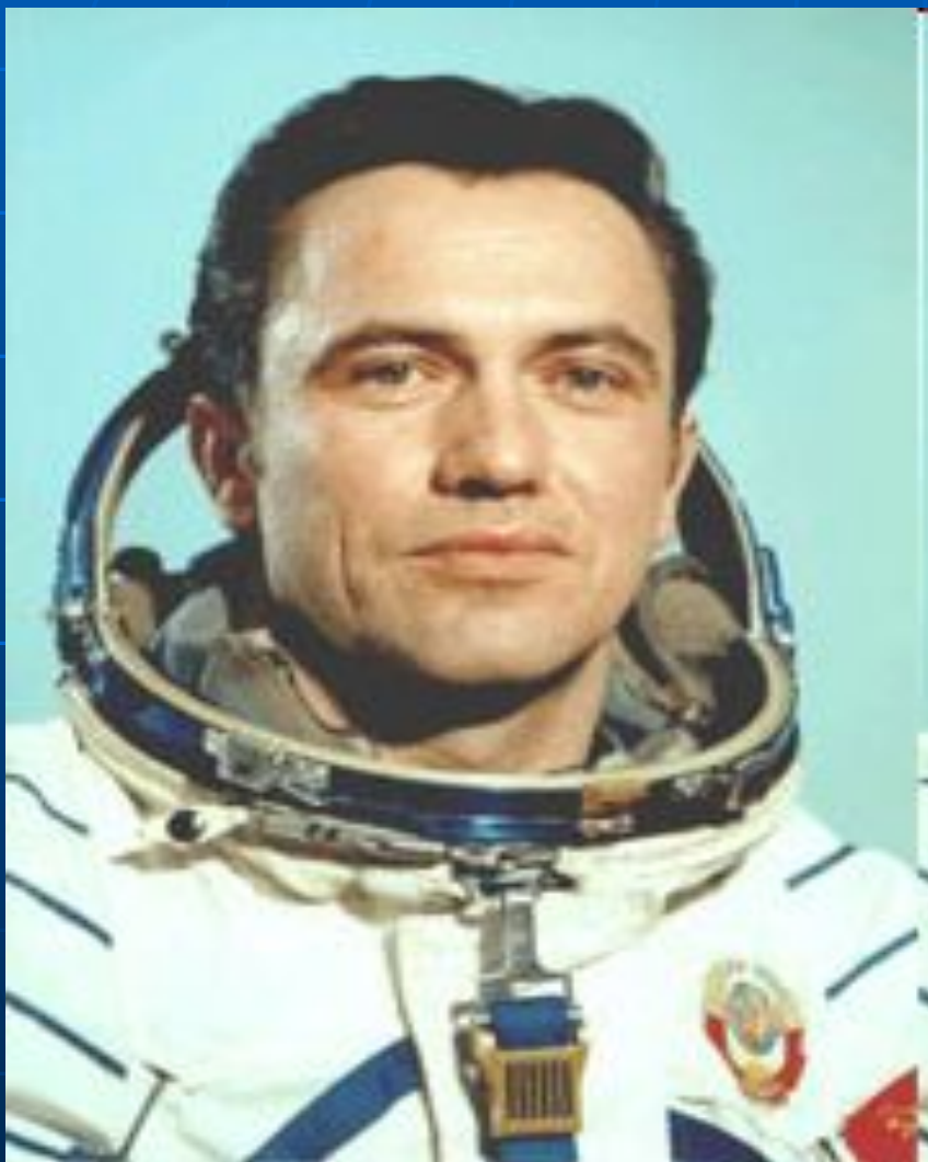
Попов Леонид Иванович, летчик-космонавт СССР, полковник.

Четыре экспедиции посещения, три из которых — международные экипажи