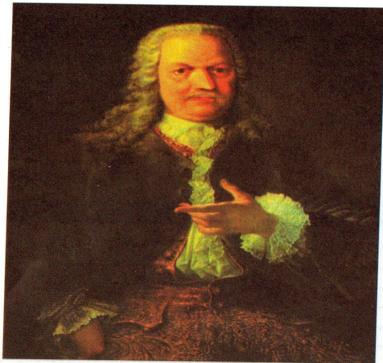
Портрет А. Демидова.