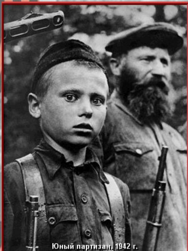
Юный партизан. 1942 г.