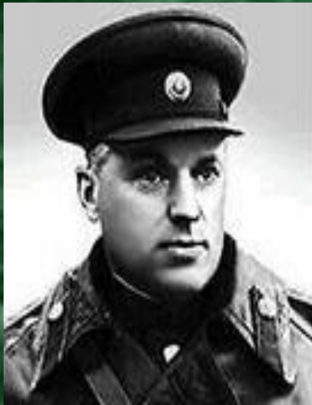
Рокоссовский Константин Константинович