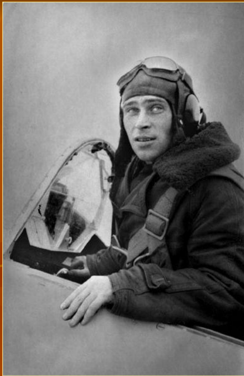
■ Лётчик Виктор Талалихин