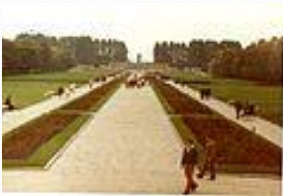
Пискаре́вское мемориальное кладбище