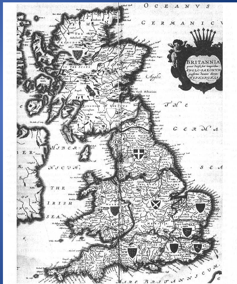
Рис. п2.2. Старинная карта Англии из известного Атласа Блау XVII века. На карте отмечена огромная стена, перерезающая английский остров пополам. Стена под названием «The Pictes Wal», то есть «Вал Пиктов», отделяет Шотландию от южной Англии. Считается, что эта карта основана на карте 1611—1612 годов, изготовленной Джоном Спиди (John Speede). Взято из [50], с. 72—73.