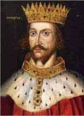
Король Генрих II (1154 – 1189 гг.)

1. Поработайте с текстом, с.156 (с 3- го абзаца) – 157