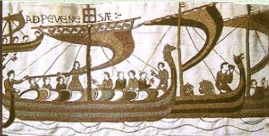
Корабли Вильгельма переправляются через Ла-Манш