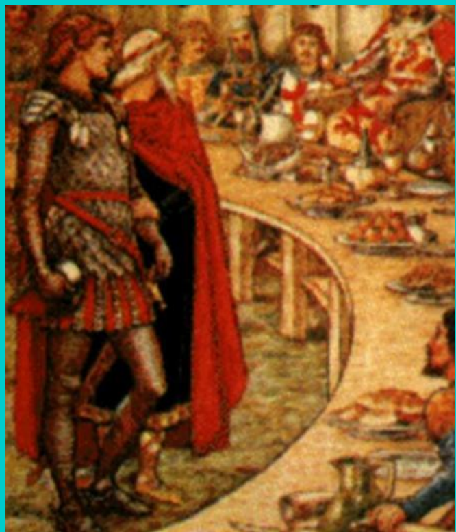
Король Артур и рыцари Круглого Стола

Ранняя история Англии известна по легендам о Короле Артуре.