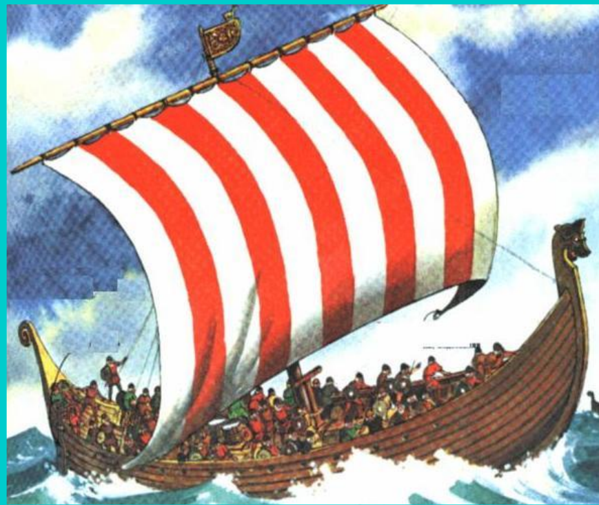
Драккар-боевой корабль викингов

Норманны обрушивались на поселения уничтожая всех на своем пути, или захватывали пленников.